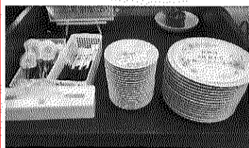
▲2枚目から使うように注意書きがされている

そんな人気のバイキングにウイルスが付着しがたが、コロナ禍による非常事態宣言が出される